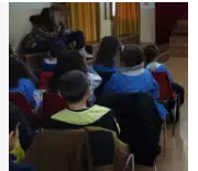
Gli alunni della N